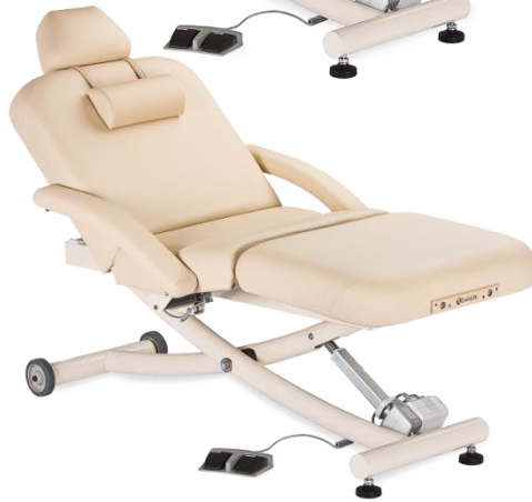
USA EarthLite - 한국독점