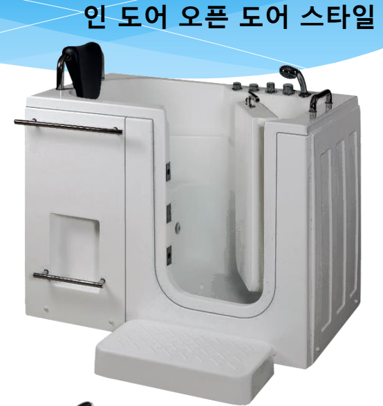
인 도어 오픈 도어 스타일