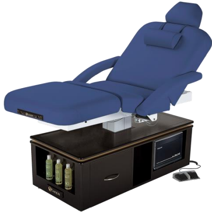
일렉트릭 전동 스파베드