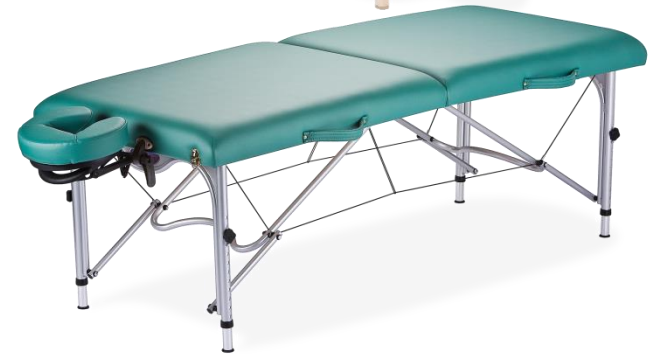
고정식, 휴대용 마사지 베드