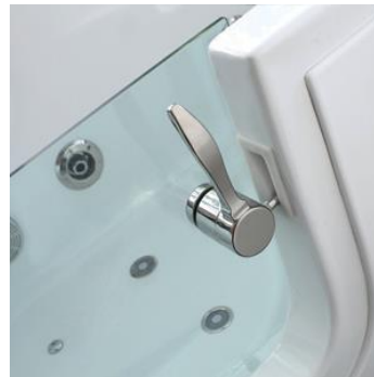
세이프 터 락 안전도어