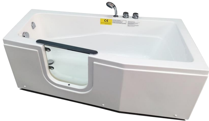
유리글래스 와식 워크인 튜브

In Door & Out Door 오픈 형 아웃도어 오픈 스타일의 노인/ 환자 / 장애우 월풀욕조 국내 다지인 의장등록 특허 전제품 전기안전인증 OEM, ODM 방식 해외생산