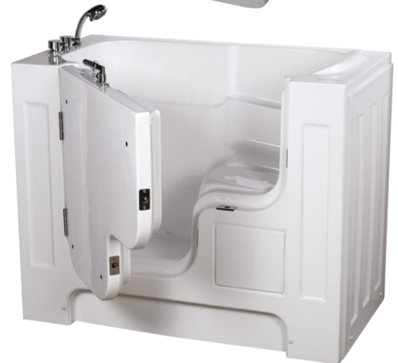
아웃스윙 오픈 도어 스타일